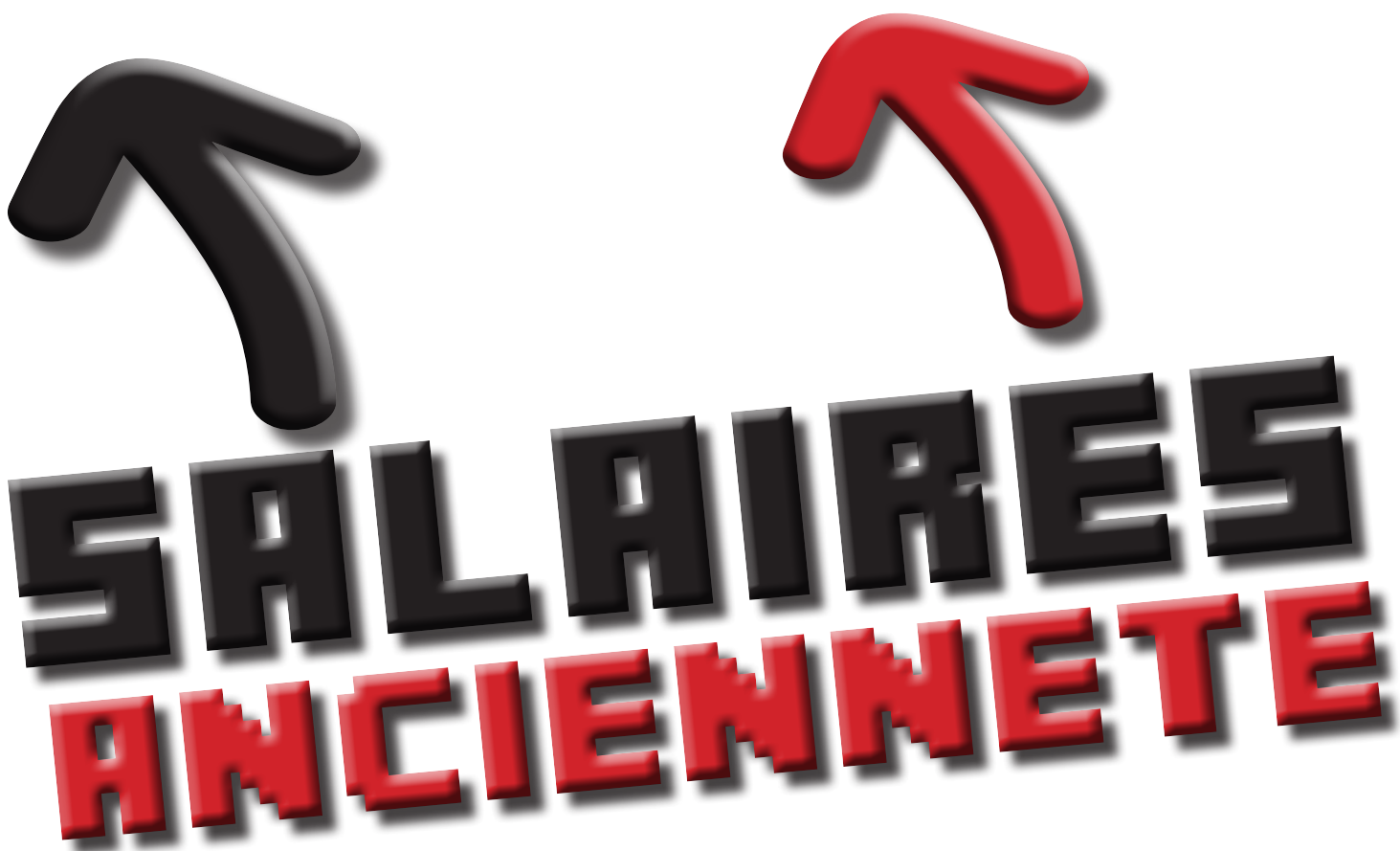
Tableau d'avancement à l'ancienneté.

Il apparaît aberrant que le reclassement ne prenne pas en compte toutes les situations professionnelles passées. Celles et ceux qui ont travaillé dans le privé se voient reconnaître leur ancienneté uniquement pour le CAPET et le CAPLP, et encore avec des conditions très restrictives.